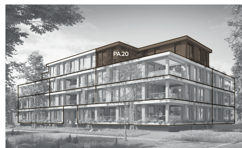
Voorgevel (oosten) & rechterzijgevel (noorden)