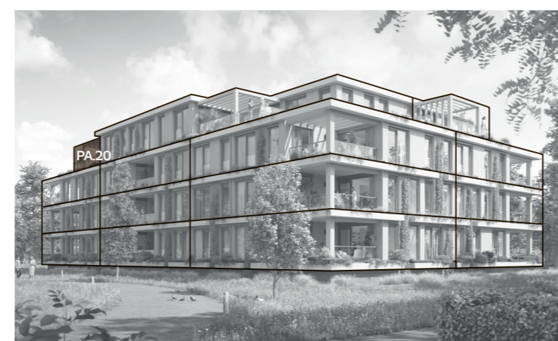
Achtergevel (westen) & linkerzijgevel (zuiden)