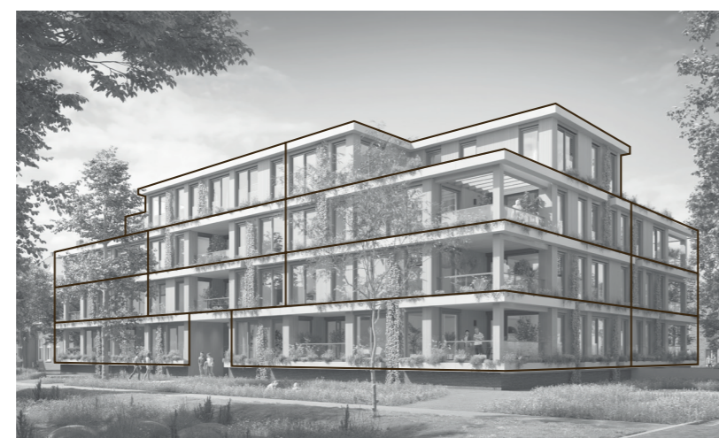
Voorgevel (oosten) & rechterzijgevel (noorden)