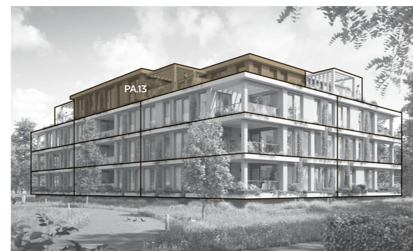
Achtergevel (westen) & linkerzijgevel (zuiden)